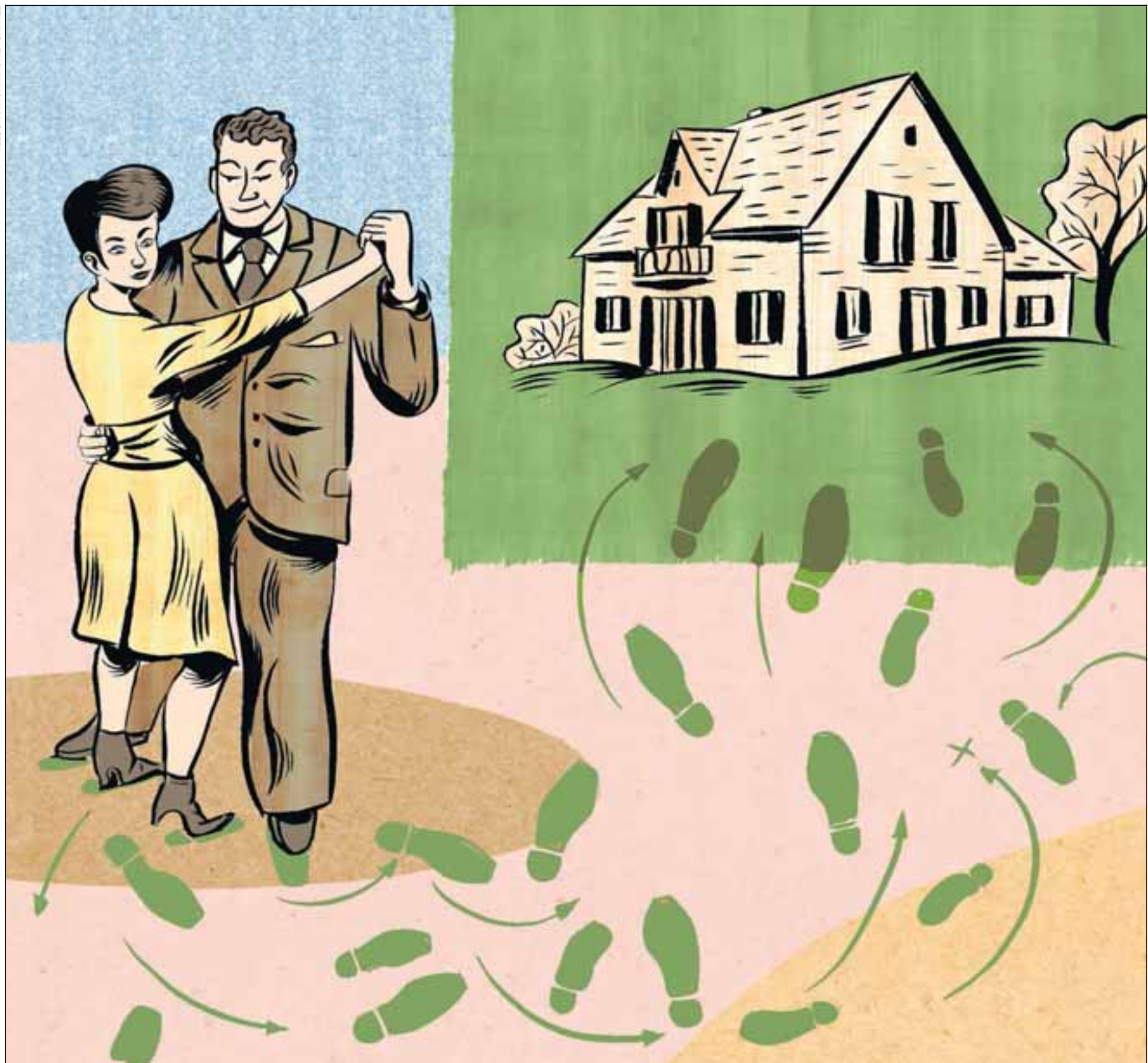
ILLUSTRATION: ANDREA CAPREZ