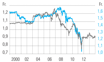
Vergl. d. Wechselkursentwicklung 1978 und 2011 ■ D-Mark-Franken-Kurs, um zirka 33 Jahre verschoben ■ Euro-Franken-Kurs (rechte Skala)