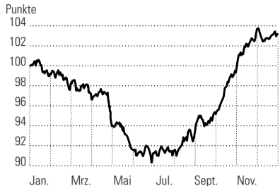
Jahresdurchschnittsverlauf von Weizen (über 37 Jahre) QUELLE: WWW.SEASONALCHARTS.COM NZZ-INFOGRAFIK / cke.

Verblässender Glanz der Notenpresse sev. · Die zwei Runden der quantitativen Geldpolitik (QE1, QE2) in den USA haben die Renditen der Staatsanleihen steigen lassen. Dabei war der Effekt in der ersten Runde insgesamt grösser. Die Effekte der zweiten Runde waren an den Aktien- und Rohwarenmärkten stark, am Obligationenmarkt jedoch bereits etwas schwächer. Die Bank Sarasin meint, dass Hinweise auf eine dritte Runde der quantitativen Lockerung wegen der verdüsterten Wachstumsaussichten schon bald erfolgen könnten. Der Effekt der quantitativen Geldpolitik könnte allerdings mit jeder Runde geringer werden. Die Bank Sarasin weist zudem darauf hin, dass sich die allgemeine Stimmungsaufhellung nie richtig auf die Realwirtschaft übertragen hat: Das Wachstum in den USA sei trotz den Interventionen enttäuschend gewesen. Aus diesem Grund dürften die Märkte auf QE3 eher skeptisch reagieren.