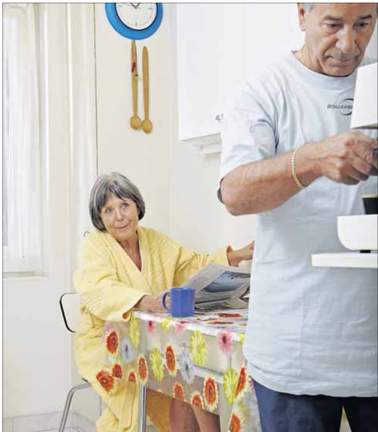
In den eigenen vier Wänden zu leben, bringt Sicherheit, aber auch Lasten in Form von Hypothekarzinsen und Eigenmietwert.

Das tragbare Eigenheim sollte für viele Besitzer ein wichtiges Ziel sein, das es für das Alter anzupeilen gilt. Denn die ideale kleinere Eigentumswohnung ist nicht immer erschwinglich. Gerade bei Hauseigentümern mit relativ hoher Verschuldung und eventuell auch noch reduzierter PK-Rente – oft wurde Kapital für den Hauskauf bezogen und nicht wieder aufgestockt – ist eine Wohnkosten-Planung für das Alter sehr wichtig. Fazit: Wohneigentum nicht unbedingt als Anlage kaufen, sondern als Objekt, in dem man sich auch im Alter noch wohl fühlt.