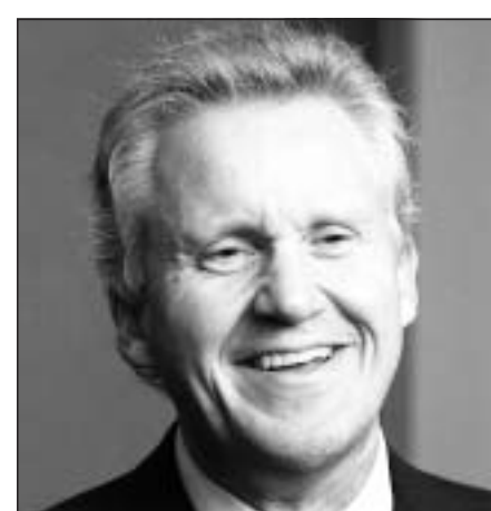
Jeffrey Immelt, Konzernchef von GE, hat die Kursschwäche ausgenutzt und sein GE-Portfolio aufgestockt.

General Electric steckt seit 2002 in einem tiefgreifenden Restrukturierungsprozess. Die schiere Grösse, das historisch gewachsene und mitnichten übersichtliche Produktportfolio machte den Konzern schwerfällig. Das Entflechtungspotenzial war gewaltig. Traditionelle, margenschwache Einheiten bremsten die Gewinndynamik anderer Sparten. Immelt baute den Konzern um, trennte sich unter anderem von der Plastik- und Materialeinheit sowie von einem Grossteil des Versicherungsgeschäfts. Die freigewordenen Mittel investierte er in neue Wachstumssegmente wie Flugzeugtriebwerke oder Fördertechnologien für Öl und Gas. Gleichzei-